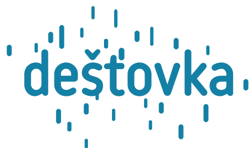
jednobarevné provedení v barvě