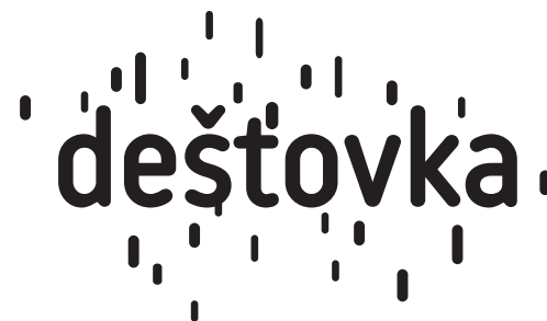
jednobarevné provedení v černé