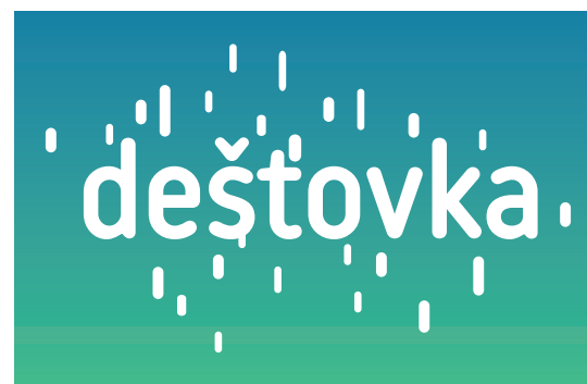
negativní jednobarevné provedení